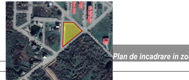
Plan de incadrare in zona